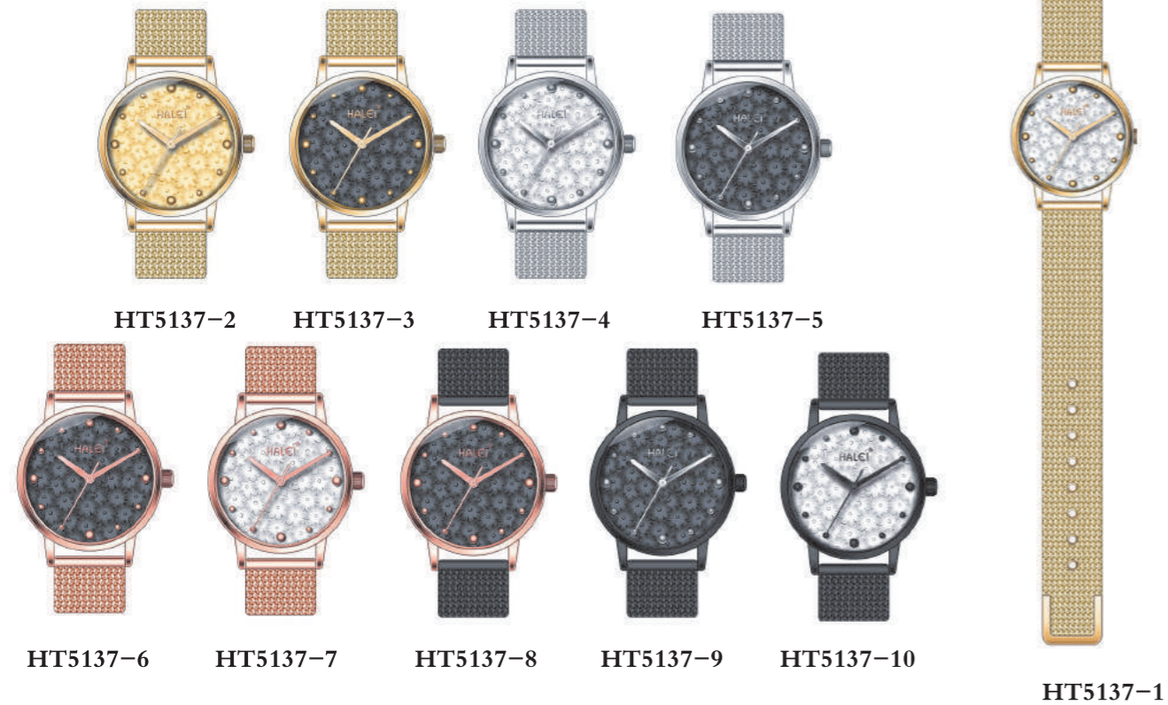
RELÓGIO EM AÇO A PROVA D'ÁGUA ORIGINAL IMPORT QUARTZ MOV'T ALLOY CASE, STAINLESS STEEL BAND HARDENED GLASS WATER RESISTANT 1ATM