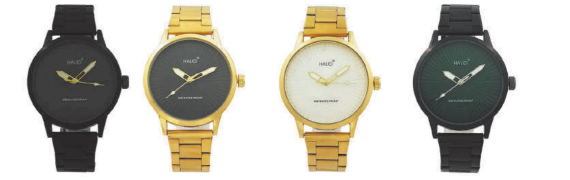
8810G-1 8810G-2 8810G-3 8810G-4