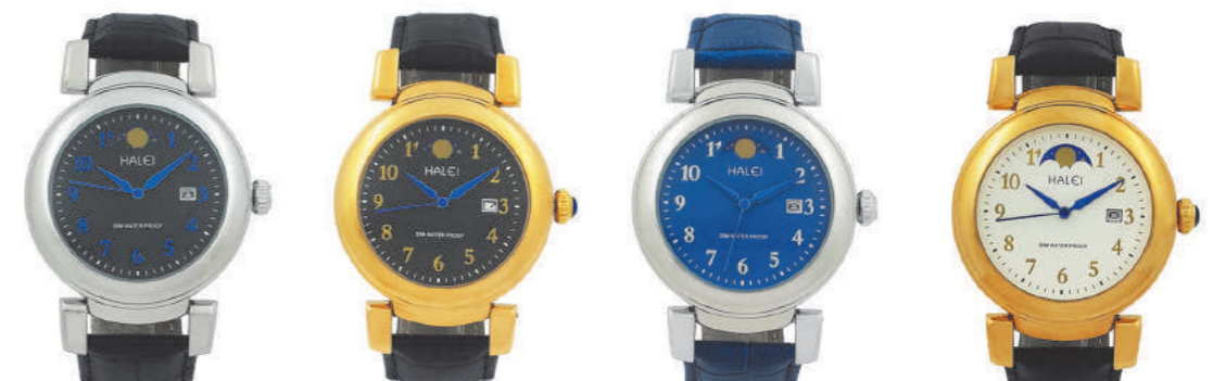
NO366-1 NO366-2 NO366-3 NO366-4