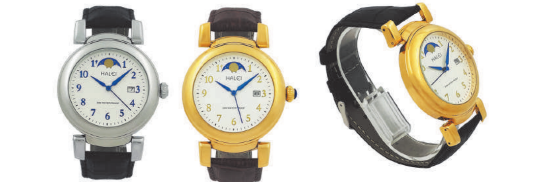
NO366-5 NO366-6 NO366-4