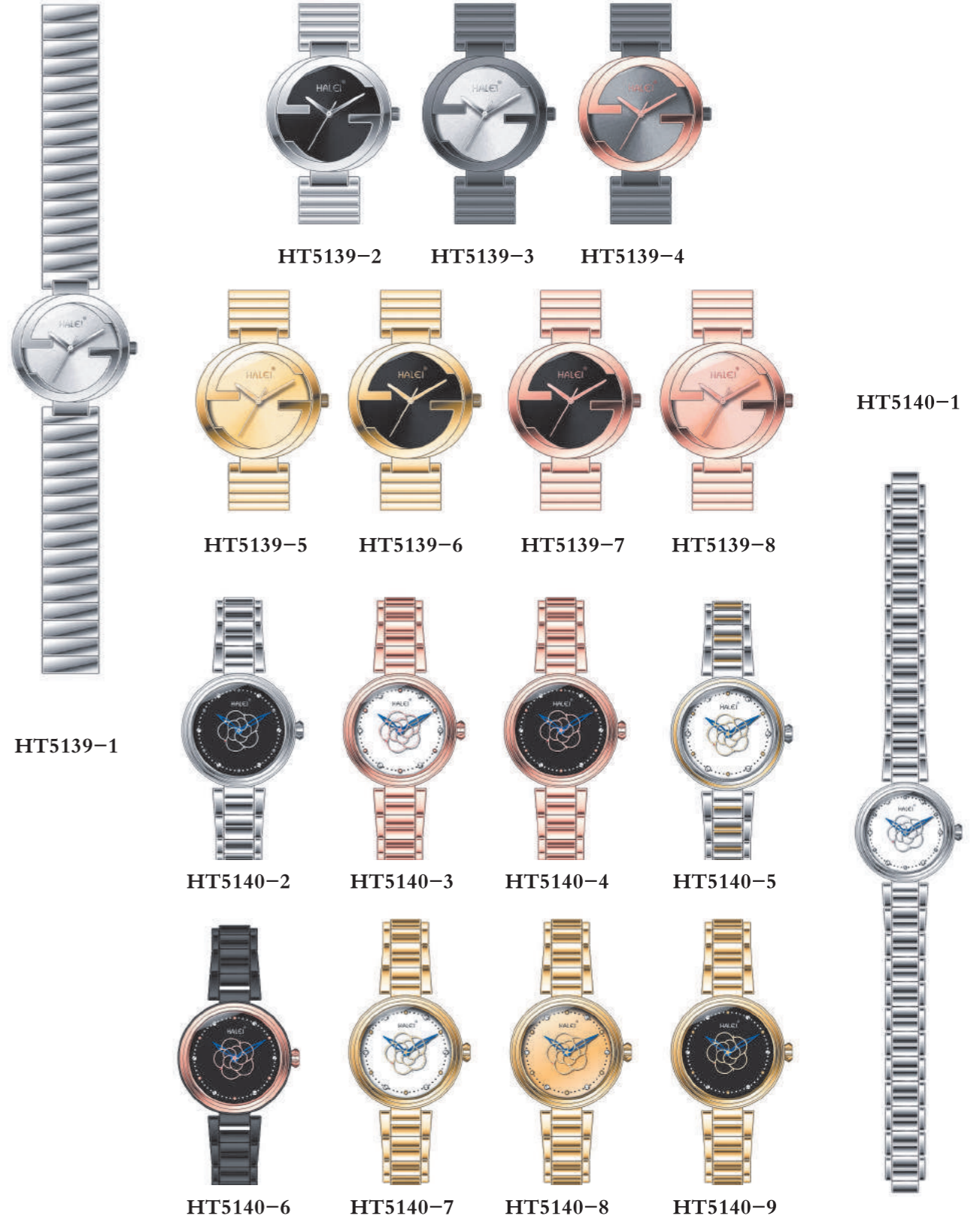
RELÓGIO EM AÇO A PROVA D'ÁGUA ORIGINAL IMPORT QUARTZ MOV'T ALLOY CASE, STAINLESS STEEL BAND HARDENED GLASS WATER RESISTANT 1ATM