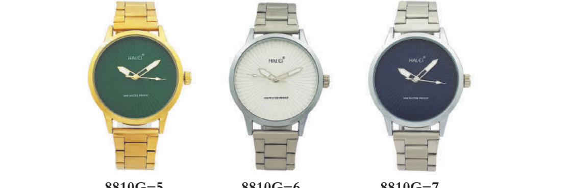
8810G-5 8810G-6 8810G-7